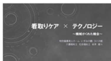
写真④ 実践研究大会

国が方針として定めている「生産性の向上」介護の価値を高める」という取組に対して、当組では今後も組織として継続的に取り組んでいくことにより、職員一人ひとりがモチベーション高く職務に励むことが出来るような環境作りに努めていきます。